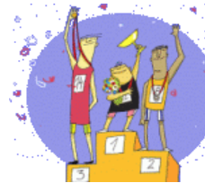
De eerste, de tweede, de derde